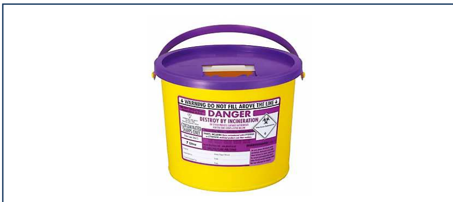
شکل ۱-۱۱: ظرف مورد استفاده برای ذخیره سازی پسماندهای نوک تیز آلوده شده توسط پسماندهای دارویی سایتوتوکسیک و سایتواستاتیک

Animal EWC Code = 18 02 07 → کد مربوط به استفاده های حیوانی