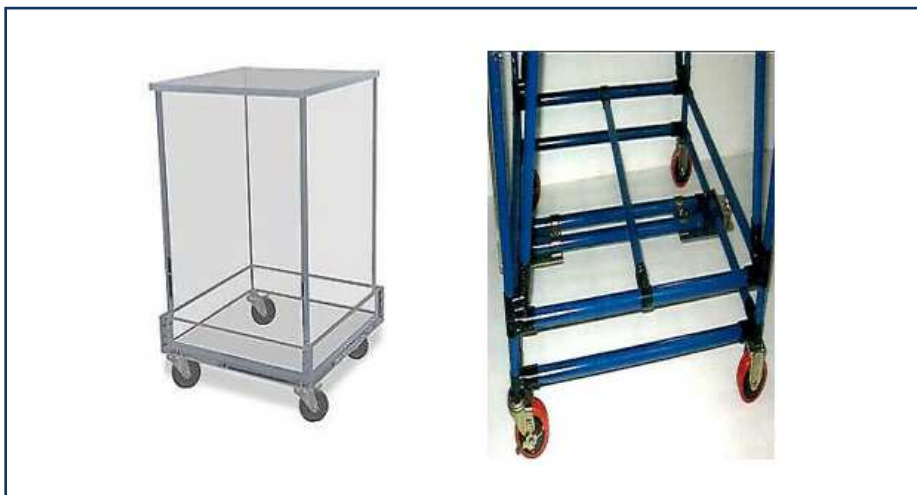
شکل ۱-۷: وسایل مورد نیاز برای انتقال و حمل و نقل پسماند شیمیایی درون سایت

پسماندهای شیمیایی تولید شده باید ذخیره و از نقطه تولید جمع آوری شوند. بعضی اوقات ممکن است نیاز باشد پسماندهای شیمیایی از یک نقطه به نقطه ای دیگر و یا جایگاه ذخیره سازی موقت پسماند منتقل شوند. برای حمل و نقل راحت تر این نوع پسماندها باید از وسایل چرخ داری که برای نمونه در شکل ۱-۷ آورده شده است استفاده کرد. لازم به ذکر است تا حد امکان وسایل مورد استفاده در حمل و نقل باید اختصاصی باشند و وسایل مختلف برای هر نوع پسماند در نظر گرفته شود [۹].