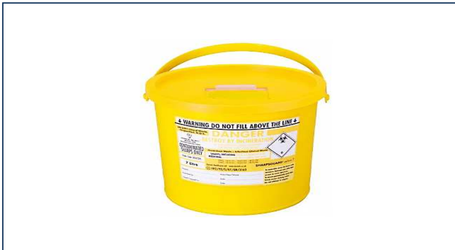
شکل ۱-۱۲: اشیاء یا پسماندهای نوک تیز آلوده شده توسط پسماندهای دارویی غیرسایتوتوکسیک و غیرسایتواستاتیک

Animal EWC Code = 18 02 03 → کد مربوط به استفاده های حیوانی