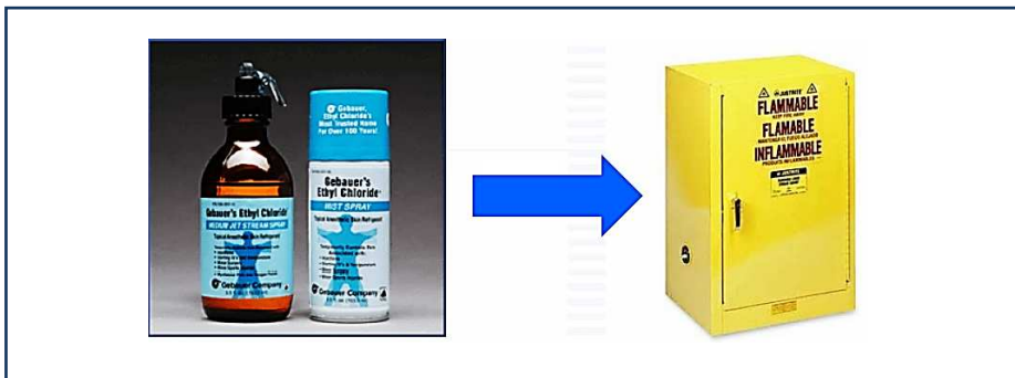
شکل ۱-۶: روش ذخیره سازی مواد قابل اشتعال